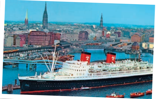
Hanseatic an der Hamburger Überseebrücke.

Da ab 1960 bereits die erste Boeing 707 der Lufthansa einen Nonstop-Flug in die neue Welt anbietet, endet die kurze Blüte des Transatlantik-Liniendienstes 1972 mit dem Verkauf der „Bremen“ nach Griechenland bzw. 1973 mit dem Konkurs der Hamburg-Atlantik Linie.