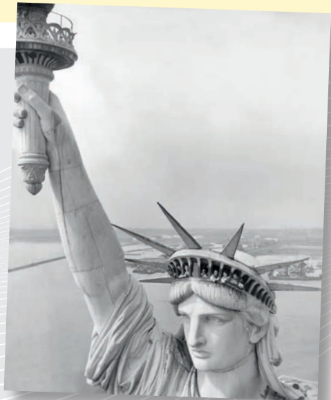
Die Freiheitsstatue in New York in den 50er-Jahren – ein Sehnsuchtsort für Touristen und Auswanderer.

In der zweiten Hälfte der 1950er-Jahre erlebt Deutschland nochmals eine größere Auswanderungswelle. Ein hoher Dollarkurs und die Chance zu schnellem