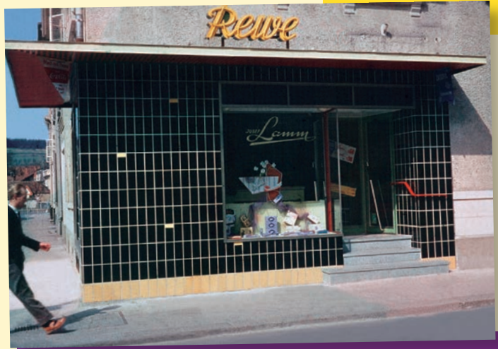
Der Kaufmannsladen an der Ecke.

kühltruhen mit „Jopa“-Eis am Stiel. Als etwas ganz Besonderes empfinden unsere Eltern die ebenfalls neu angebotenen tiefgekühlten Hähnchen – ein noch wenige Jahre zuvor kaum vorstellbarer Luxus. Neu sind Ende der 50er-Jahre auch Fassaden mit schwarzen Klinkern, welche mit einzelnen gelben Steinen elegant akzentuiert werden.