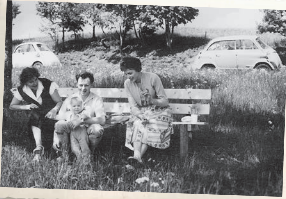
Zwischen BMW Isetta (links) und BMW 600 (rechts) auf Papas Schoß.

Wir fühlen uns wohl zwischen unseren Eltern auf der (einzigen) Sitzbank, auf welche man durch die große Fronttür kommt. Bei schönem Wetter sorgt das aufklappbare Faltdach für frische Luft.