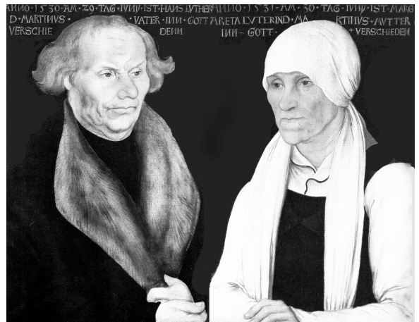
Hans und Margarethe Luther

Martin machte einen sehr guten Schulabschluss, sodass sein Vater darauf sparte, ihm ein Studium der Rechtswissenschaften zu ermöglichen.